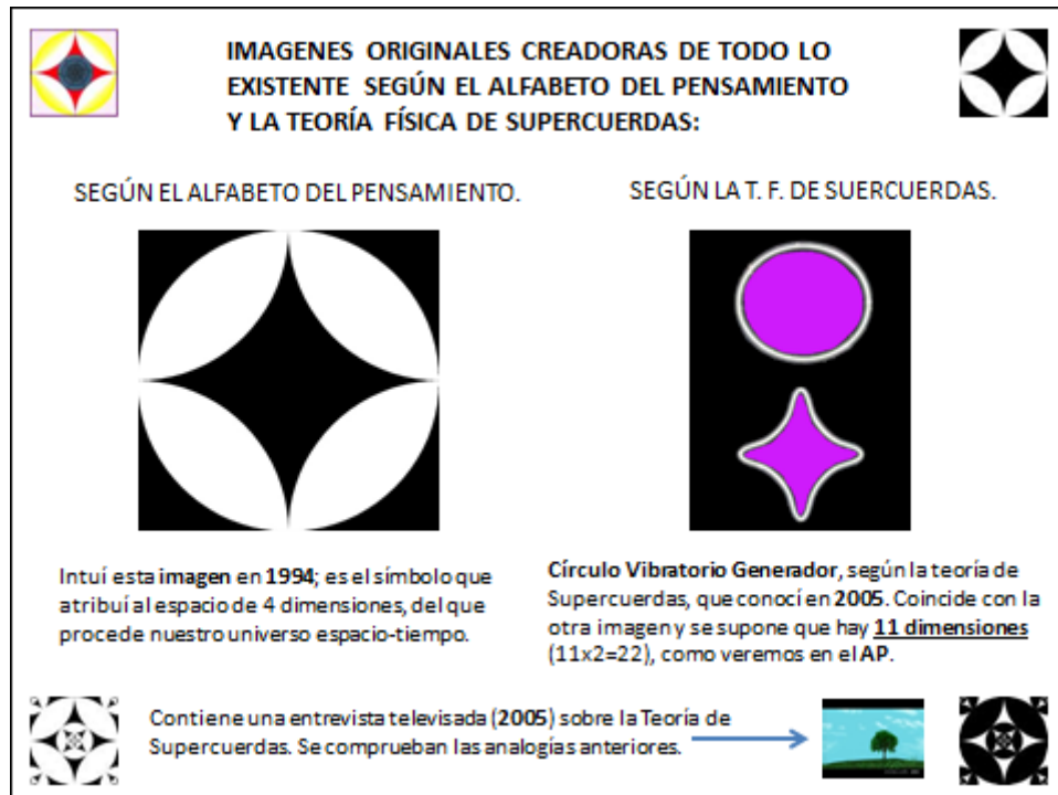
Cuadro I-1. Imágenes originales creadoras de todo lo existente.

Dicha concepción se descubre aquí de una manera directa e independiente a la de la Teoría de Supercuerdas. Diremos además que las vibraciones esenciales , que aquéllas arcos-cuerdas emiten, se expresan también en la Conciencia Humana por medio de pensamientos alfabéticos , o pensamientos básicos comunes, generadores de todo lo existente y de todo lo que pensamos.